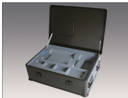
内装ウレタンフォーム例