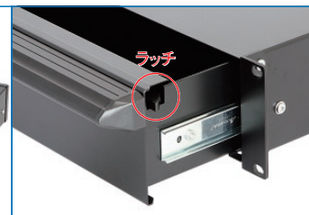
ラッチが、しまい位置で引き出しをロックし地震時等の飛び出しを防止します