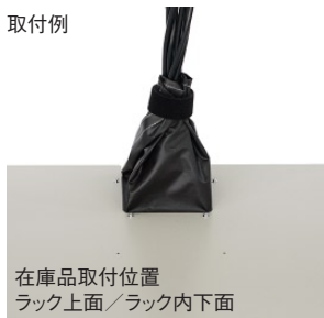
在庫品取付位置 ラック上面/ラック内下面